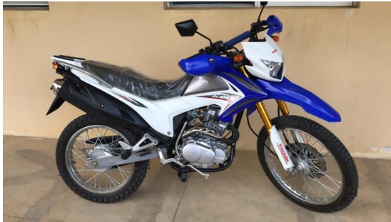
Dernière acquisition pour faciliter les déplacements