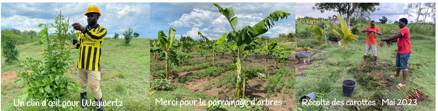
Un clin d'œil pour Weywertz