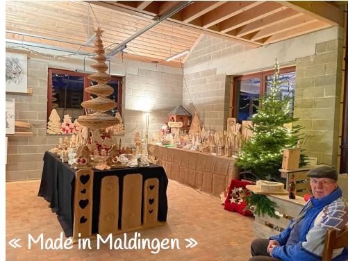
« Made in Maldingen »