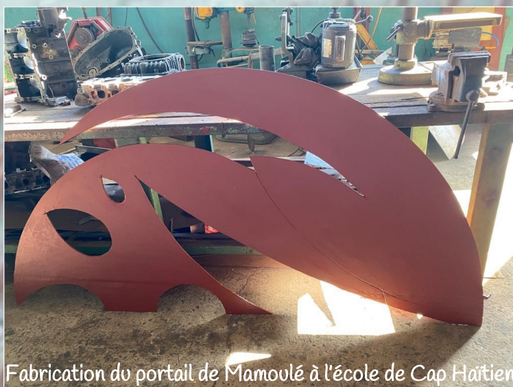
Fabrication du portail de Mamoulé à l'école de Cap Haïtien